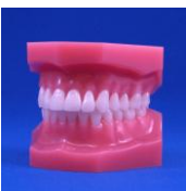
【DEMAL-001】 Arco Ideal