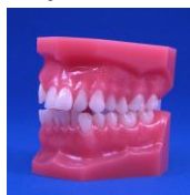
【DEMAL-002】 Caso de clase 1