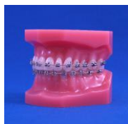
【DEORT-001】 Con brackets de metal