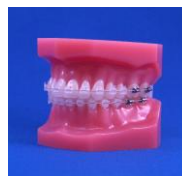
【DEORT-003】 Con brackets de ceramica

Cualquier tipo de maloclusión son disponibles.