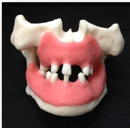
IMP-016-UL Modelo Edentulado con encía