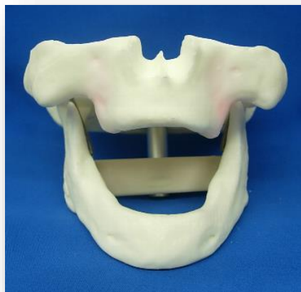
IMP-015-UL Modelo desdentado sin encía

Hay dos tipos disponibles dependiendo a su demanda de práctica